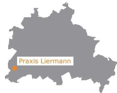
Lage in Berlin